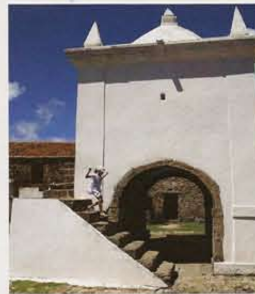
PORTUGISERNE HUSKET tydeligvis ikke at det finnes stein i Brasil. De tok med seg stein hjemmefra for å bygge festningen Forte dos Reis Magos på 1600-tallet.

med bønner og grønnsaker, setter vi kursen tilbake mot Ponta Negra. Her tilbringer vi noen timer på stranden, bader og kikker på kitesurferne som gjør vanvittig akrobatiske bevegelser på brettene sine ute i bølgene. Mens jeg inntar kokosvann rett fra nøtten og nyter den svale vinden under solen, lukker jeg øynene og prøver å la være å tenke på at jeg skal hjem en dag.