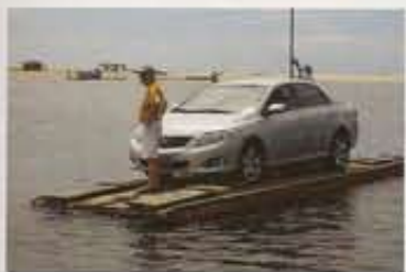
DEN NYE broen i Natal er flott, men Brasil har fremdeles lang vei å gå når det gjelder infrastruktur.