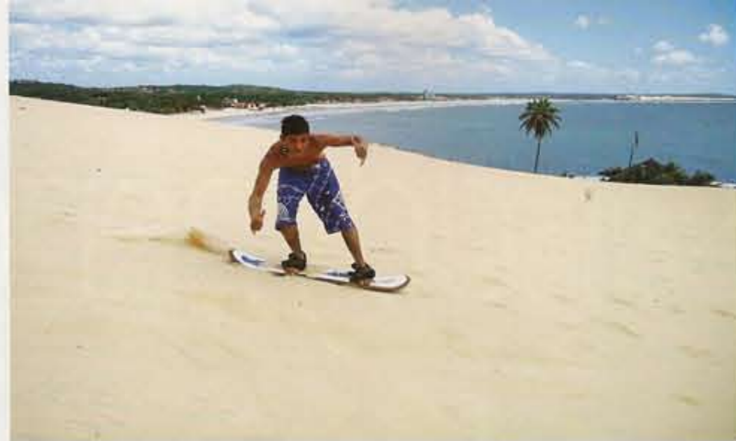
DET GÅR saktere enn på snø, men til gjengjeld er sandbrettkjøring omgitt av palmer og strender.

– Spenningstur, så klart. Bare la meg legge kameraet i sekken, så jeg ikke får sand i det. Sånn! Gi full gass!