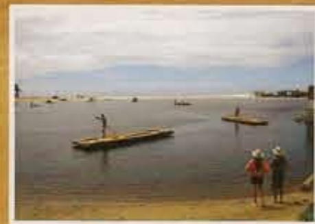
TRADISJONELL FLØTING brukes til å frakte biler over elven.

– De verste vinterdagene i juli og august kan termometeret krype ned mot 23 grader, sier juiceselgeren og hutrer ved tanken.